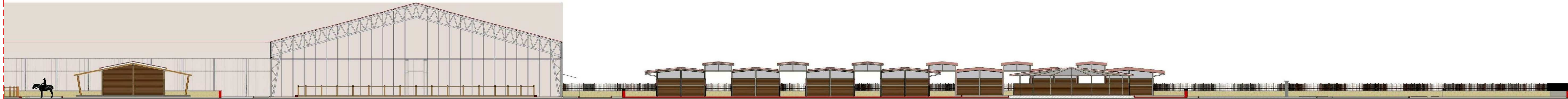
SEZIONE B - B LATO DX